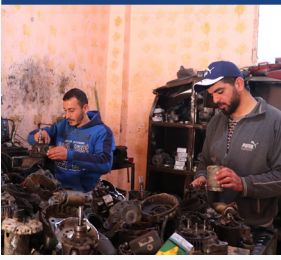
التدريب المهني/التدريب والتطوير