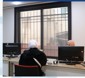
مساعدات لمرة واحدة/مصرف